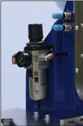
Kondenswasser-Abscheider sorgt für Langlebigkeit / Dehumidifier water separator ensures durability