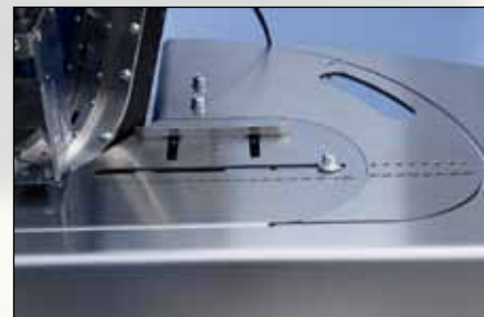
Anschläge und Positionierstifte erleich- tern schnelles und genaues Positionieren auch ohne mitgedruckte Positionsmarken / Easy, quick and exact positioning stopper-plate and eye-pin, even without printed marks