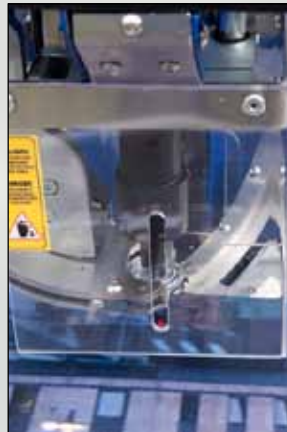
Laserpointer erleichtert schnelles und genaues Positionieren / Easy and quick positioning by using laser-pointer