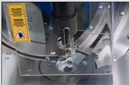
Öse wird automatisch positioniert / Automatic positioning