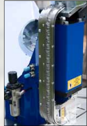
Perfekte, schnelle Zuführung der Ösen / Perfect and quick feeding of 2 part plastic grommets